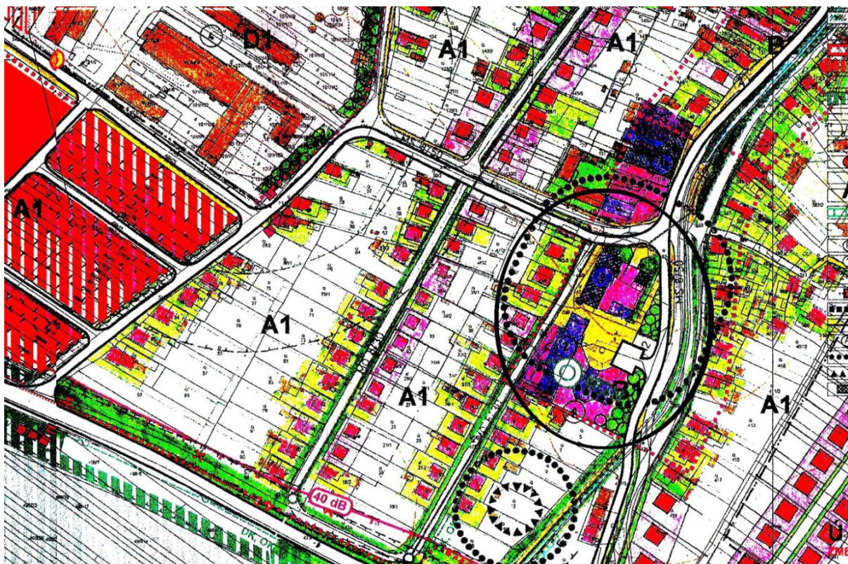
Výrez z ÚPN-O Nededza

Zámerom obce Nededza je v centre obce na Hlavnej ulici pred Obecným úradom a bývalým renesančným kaštieľom (vyčiarknutý zo zoznamu NKP SR) vybudovať námestie – centrálny verejný priestor. V Územnom pláne obce je priestor centra riešený intenzívnym využitím určeného územia v súlade s funkčným využitím. V ÚPN-O sa neplánuje asanácia žiadnych stavieb v riešenom území, ale oproti návrhu ÚPN-O je súčasný stav podstatne zmenený. Pôvodne chránené pamiatkové objekty sú z časti asanované a prestavané a preto ochranné pásmo kultúrnych pamiatok stráca opodstatnenie. Toto ochranné pásmo má sčasti opodstatnenie len z pohľadu zachovania zvyškov pôvodného kaštieľa zakomponovaných do kultúrno spoločenského objektu (v prestavbe) s kapacitou 40 návštevníkov denne a nového rímskokatolíckeho kostola. Problematické je trasovanie komunikácie – ulice Za kaštieľom a jej vyústenie do križovatky s ulicou Na Skotni, ktorá sa v oblúku križovatky priamo dotýka objektu kostola.