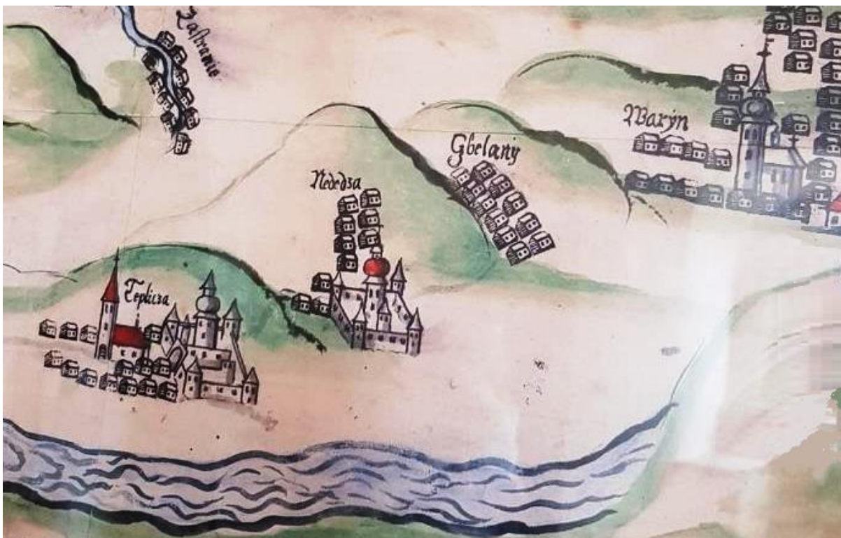
Dobový obraz historického osídlenia na pravej strane Váhu

8.1 Riešené územie centra je zároveň historickým centrom Nededze, čo dokumentuje o.i. dobová kresba osídlenia na pravom brehu Váhu. Centrum obce požaduje vyhlasovateľ riešiť ako pešiu zónu, ktorá je v dobrej pešej dostupnosti pre návštevníkov a obyvateľov. Túto je potrebné navrhnuť tak, aby bola dobre napojená pre peších a dopravnú obsluhu s minimalizovaním existujúcich a vytváraním nových kolíznych bodov a úsekov. Odporúča sa riešiť cyklistické napojenie centra obce na cyklotrasu zo Žiliny.