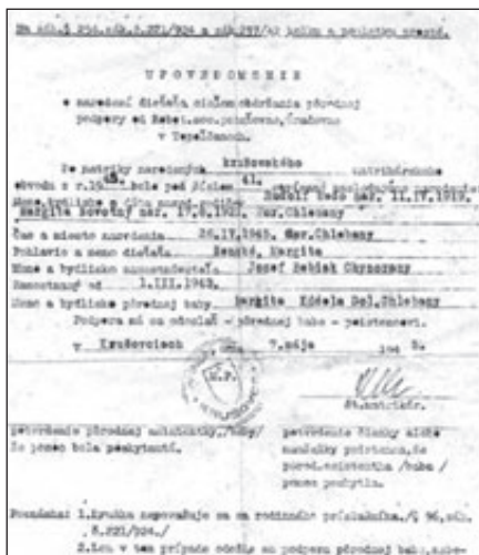
Platba pôrodnej babicule – potvrdenie.

Krstiny boli v minulosti radostnou udalosťou, ale i výlučne ženskou záležitosťou. Na oslave sa zúčastňovali kmotrovci, pôrodná baba a najbližší príbuzní. Pozývať hostí nebolo zvykom, každý vedel, či sa mu patrí, alebo nepatrí prísť. Po obede zoberala baba do ruky dve varešky (ako husle so slákom) a zaspievala: Ty moje husličky z jedľového dreva, do mojej ručičky veľa grošov treba. Tieto oslavy mali často bujarý priebeh, oslavovalo sa až do skorých ranných hodín a aj