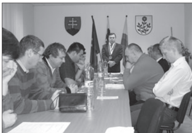
Zložili sľub vernosti, už im začnú starosti.