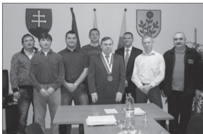
Máme ich tu všetkých pokope, veríme, že každý za Nededzu kope.

Nech sú šťastní, nech sú zdraví, nech sa im v práci dobre darí.