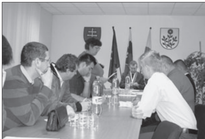
Predsedníčka komisie na úvod povstala a výsledky volieb všetkým prečítala.