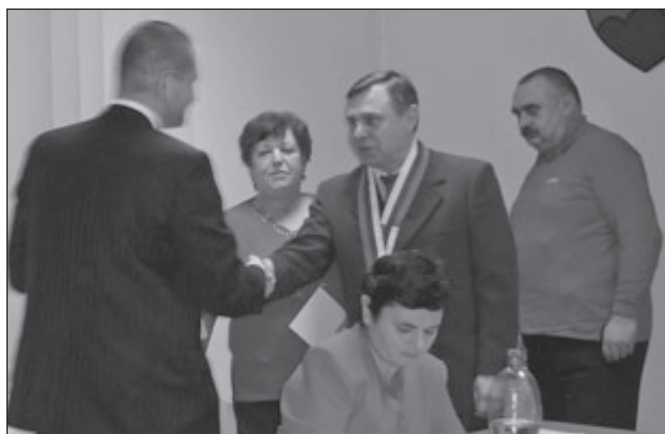
Aj oni s tým súhlasili, sľub vernosti potvrdili