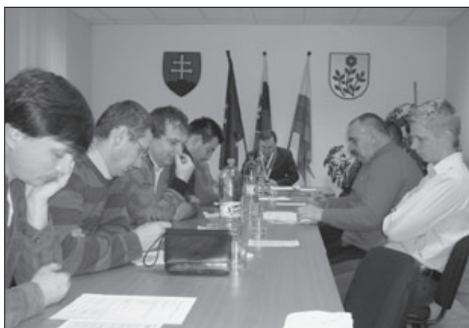
Starostí má vyše hlavy, s poslancami sa on radí.