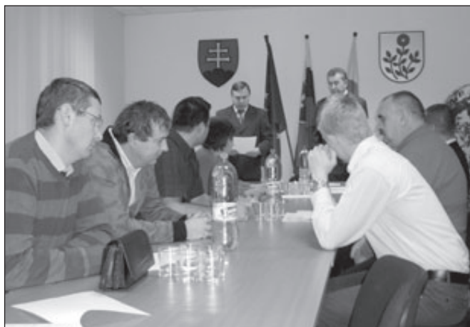
Sľub starosta zložil práve, na papieri je to dané.