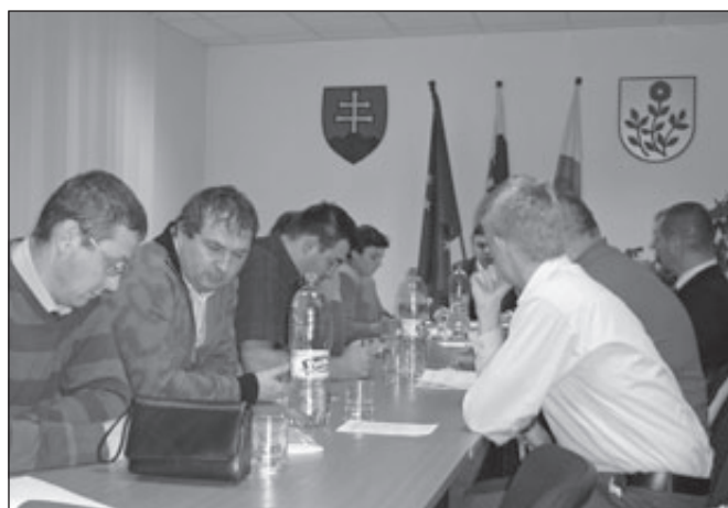
Či sa dobre dohodli, či sa správne rozhodli.