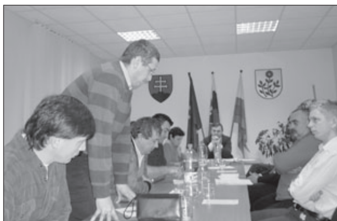
Či hlasovali za správnu vec, či je to dobré pre obec.