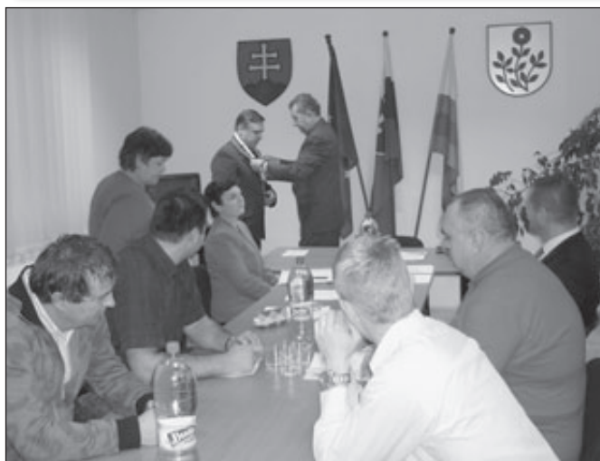
Už nám z toho nevycúva, začala mu pracovná zmluva.